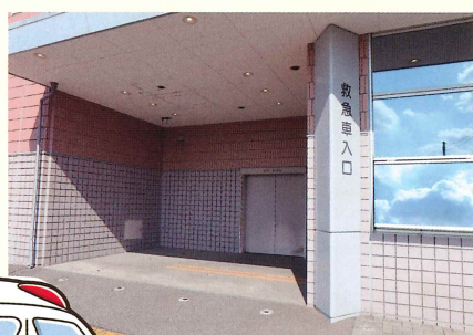
救急センター外観