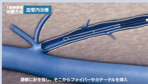
静脈に針を指し、そこからファイバーやカテーテルを挿入

血管内治療は、大伏在静脈および小伏在静脈の静脈瘤が適応となります。局所麻酔下に、エコーを使用して、血管内にカテーテルを挿入し、レーザーで発生した熱により静脈を焼灼および閉塞する治療方法です。