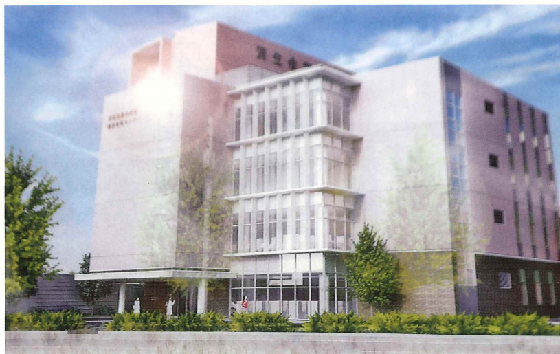
令和6年7月末 完成予想図