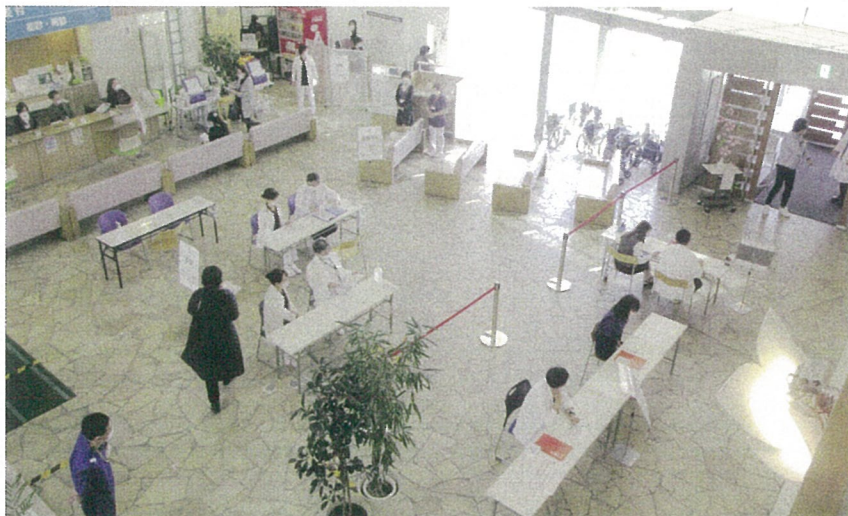
職員のワクチン接種の様子