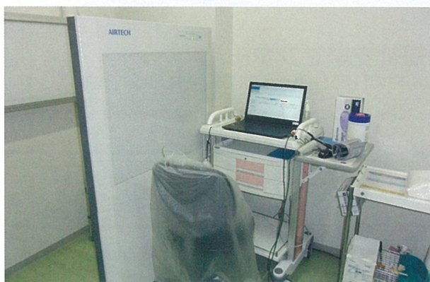
発熱者用診察室 空気清浄機付きパネル設置

使い方を工夫したり職員が手作りして乗り切っています。病院の入り口も1ヶ所にし、「熱がある」「息苦しい」「強いだるさがある」患者は感染リスクがあると考え外来待合場所を決め、他患者と交わらないように区分しています。また、救急搬送される患者さんの中に感染リスクが大きい患者が少なくなく、担当する医師、看護師は練習してきた感染対策を確実に実践しています。業務が終わると1日を振り返り次の業務につなげていく、そんな毎日の繰り返しでした。5月中旬になり、富山県内の陽性患者発生も見られなくなり病院全体が落ち着いています。しかし、今は第2波に備えていつでも対応できるようにしています。