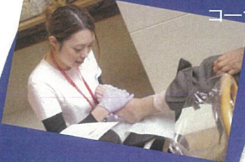
血管年齢測定・フットケア コーナー

※糖尿病デー弁当 (500Kcal、塩分2g) 管理栄養士監修による バランスの良い健康食です (内容は一部異なります)