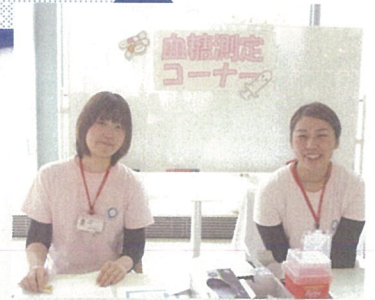
血糖測定コーナー